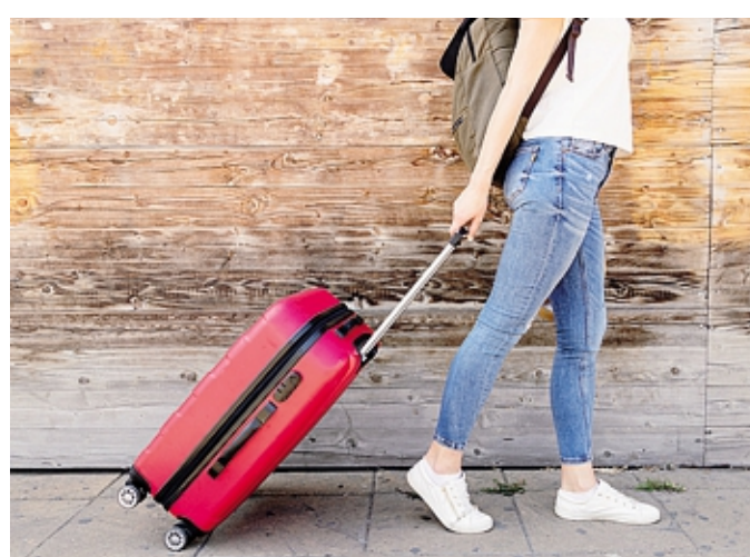
In città gli immobili per gli affitti brevi sono 1.650

Ormai, il comparto-vacanze è sempre più orientato a queste soluzioni. Nell'intera provincia gli esercizi ricettivi sono 4.865: di queste, gli appartamenti e i B&B sono 4.475, in pratica il 92% di tutte le attività. «Resistono» 250 alberghi, oltre a 71 agriturismi, 12 campeggi, 18 ostelli e 39 rifugi di montagna. Il settore delle case e appartamenti vacanza - gestiti in forma imprenditoriale o non imprenditoriale, con la partita Iva o con la cedola-