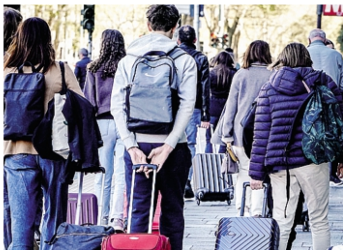
Sempre più turisti scelgono Bergamo

■ Sono 911 gli «host»: il 72,6% ha una o due unità da gestire. I grandi host sono il 5%